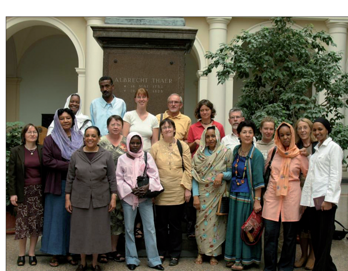
Abb.1: Ahfad-Humboldt-Link Programme. Women in Development 1998-2008

Die besondere Herausforderung hierbei ist, ein didaktisches Konzept für die Kooperation zwischen zwei Universitäten zu entwerfen, das darüber hinaus in einer fremden Sprache (Englisch) kommuniziert und umgesetzt werden soll und gleichzeitig an e-Learning-Kompetenzen heranführen will.